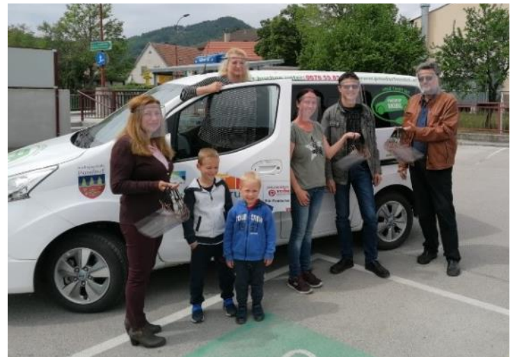
Arbeitskreis Gesunde Gemeinde!

„Noch nie zuvor war es uns so bewusst wie heute, wie wichtig unsere Gesundheit ist. Jede/r sollte dazu seinen eigenen Beitrag leisten. Besonders wichtig ist hier die Prävention.“